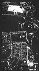
A Parent's Story