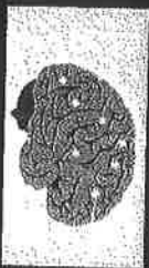
Help for Addiction