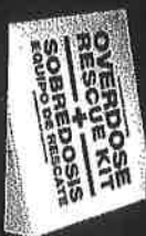
Signs of Overdose